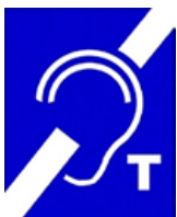
Figura 6: Identificación de bucle magnético

Se han instalado bucles magnéticos en los mostradores de atención, para facilitar la comunicación con las personas con discapacidad auditiva.