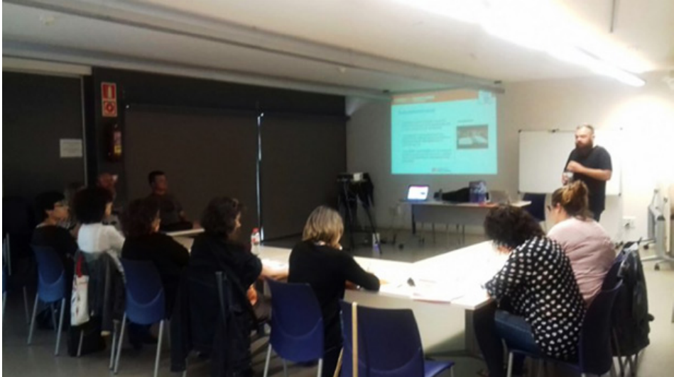
Figura 8: Sesión de formación “Trato adecuado hacia personas con capacidades diversas”