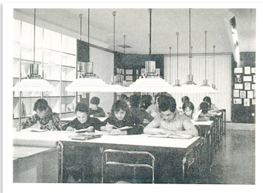
Interior de la nova Biblioteca Popular de Bellvitge